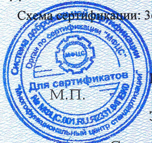
Схема сертификации: Зс.